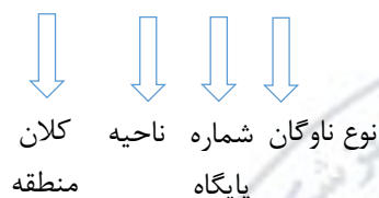
«جدول شماره ۳»